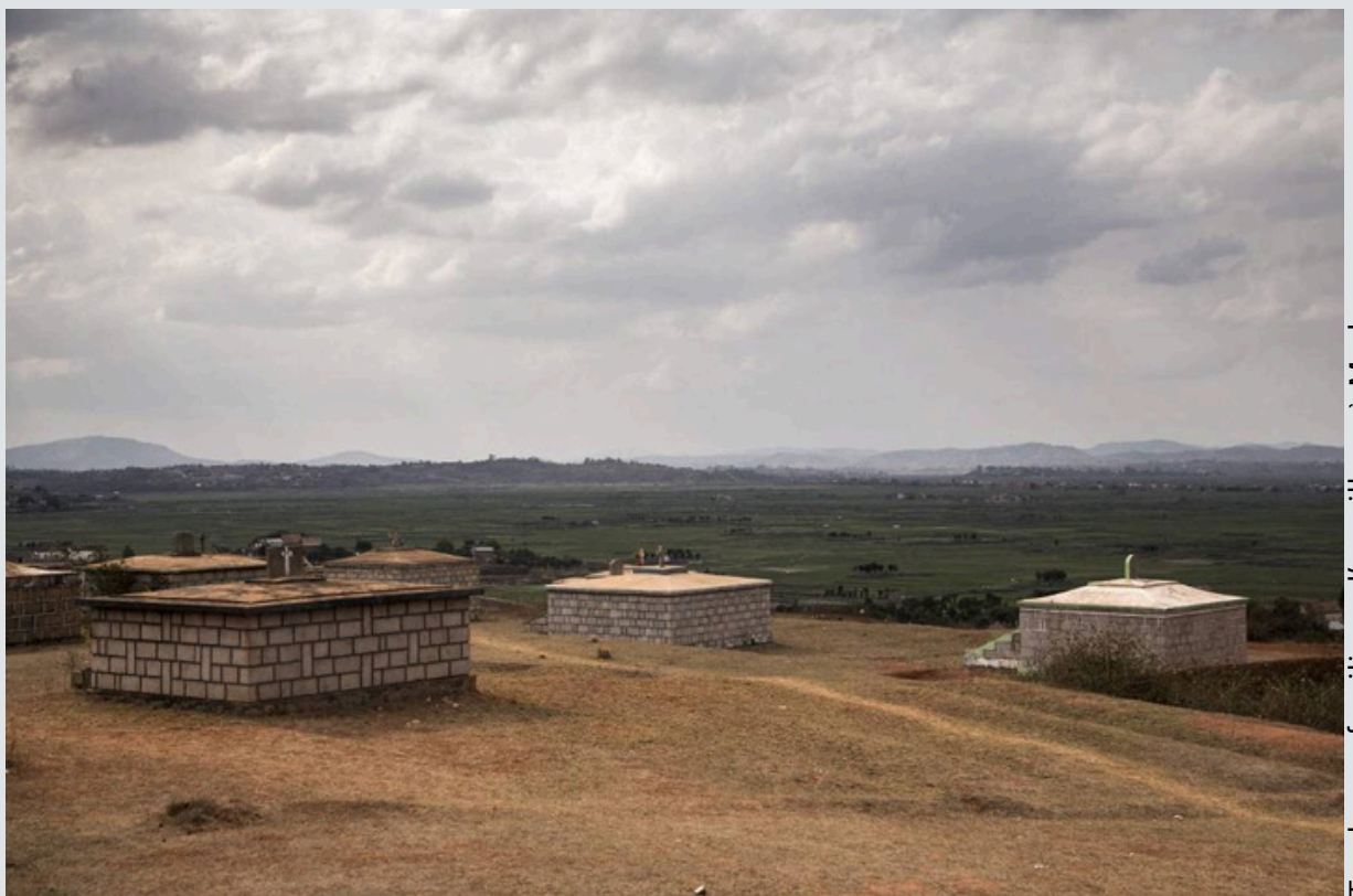
Tombeaux familiaux d'un village à Madagascar

Il y a aussi l'usage des pleureuses, pratique qui remonte à l'Égypte ancienne et à la Grèce antique. En Europe , cela s'est beaucoup vu au XIX me siècle, et cela se voit encore un petit peu aujourd'hui en Grande Bretagne . Mais de nos jours, c'est surtout en Chine et à Taiwan que nous avons le plus souvent recours aux pleureuses. Le rôle de ces personnes est de venir aux enterrements (le plus souvent invitées par la famille des défunts) et de montrer une grande tristesse. Une tristesse sincère, c'est une véritable prouesse d'actrice.