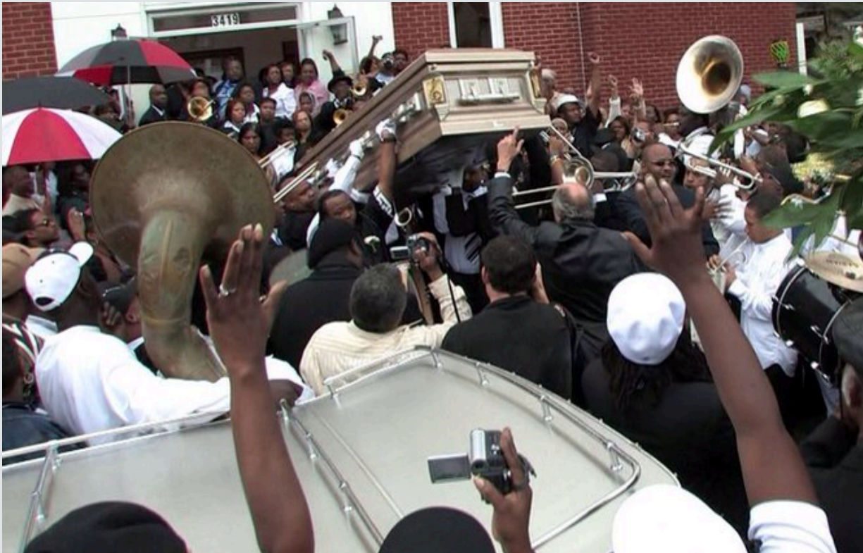
Jazz funéral... où le cercueil est au milieu du Brass Band

A la Nouvelle-Orléans , l'enterrement est vu comme la célébration de la vie de la personne plutôt que comme le deuil de sa mort. Le cortège se fait alors en musique avec une Jazz Band qui suit le cercueil jusqu'au cimetière. Tout le monde (même les passants) est invité à se joindre à la fête.