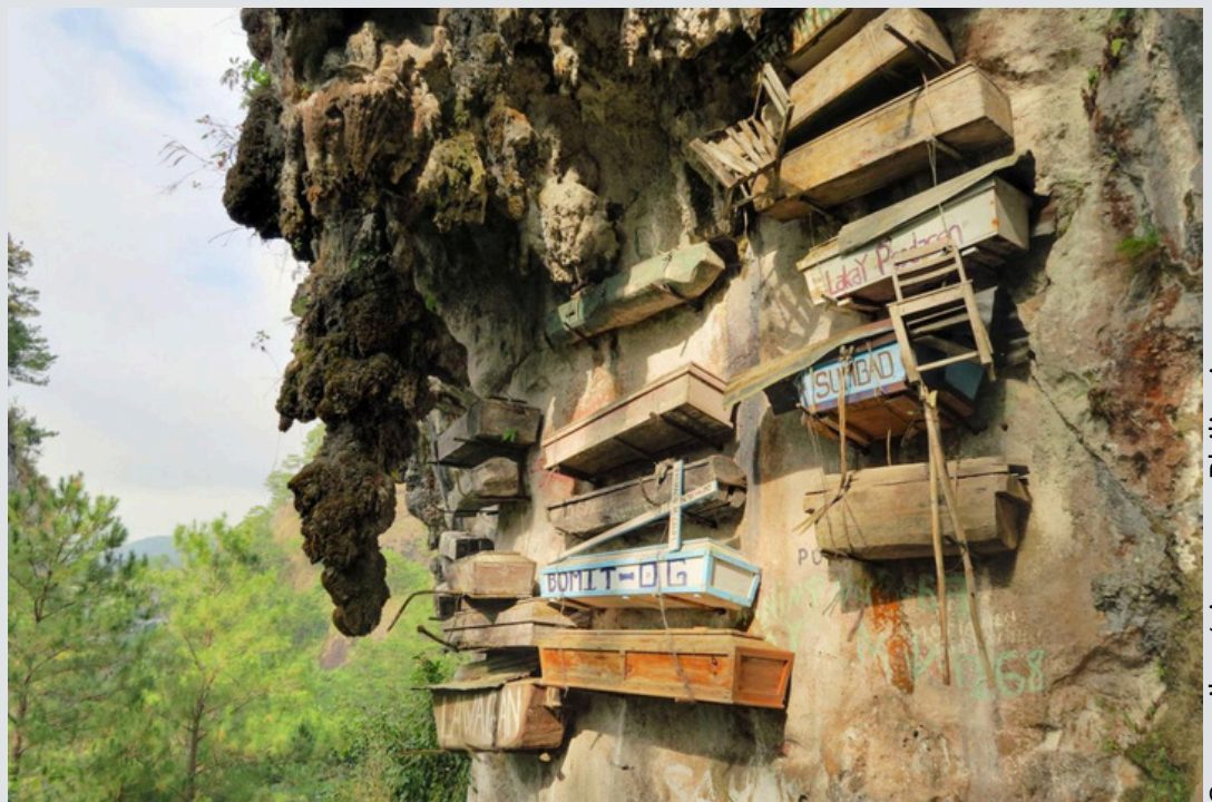
Cercueils aériens aux Philippines

Aux Philippines , dans le village de Sagada, les cercueils sont suspendus sur le flanc de la falaise. Cela permettrait de faciliter le transfert de l'âme au ciel, mais aussi de laisser les morts reposer en paix, à l'abri des animaux, en profitant du vent et du soleil.