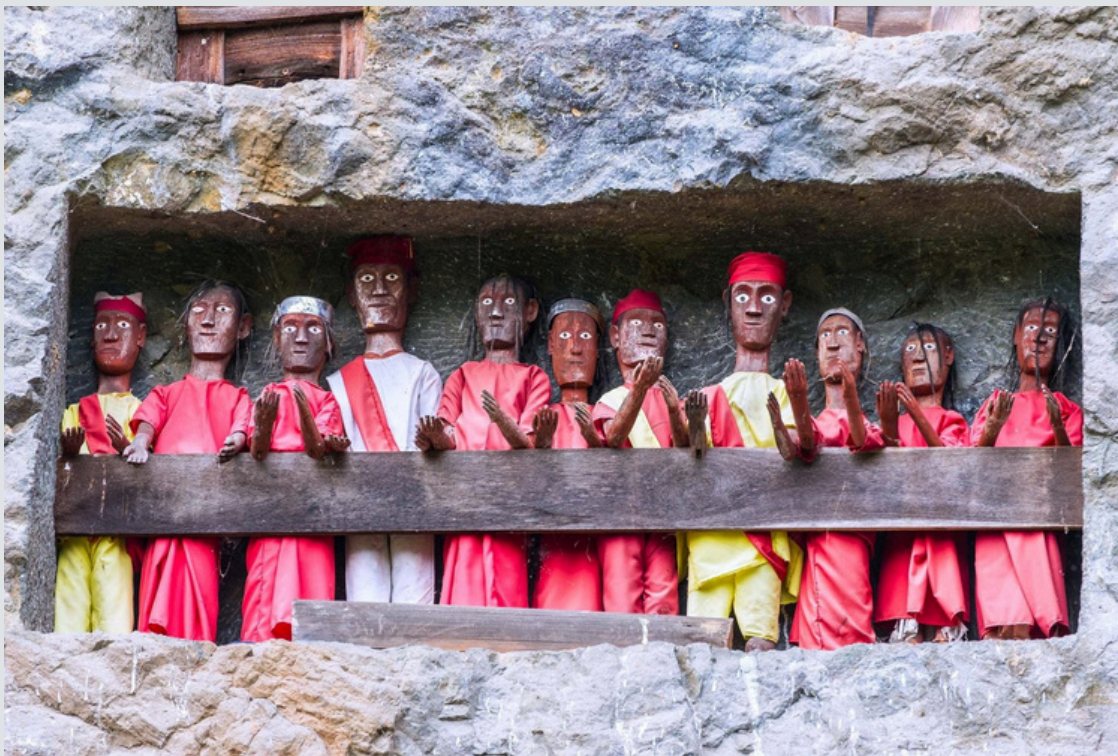
Tau-tau, poupées mortuaires indonésiennes

En Indonésie , le groupe ethnique des Tojada a des rites funéraires bien à lui. Tout d'abord, les tombes des familles nobles sont creusées dans des falaises, avec des balcons sur lesquels sont perchées des poupées en bois à l'effigie des défunts. Ces poupées s'appellent des Tau-tau , elles sont sculptées par des spécialistes et sont placées dans une posture particulière, avec une main tendue vers le ciel. Durant la cérémonie funéraire, de nombreux combats de coqs et de buffles sont organisés, ainsi que des sacrifices de buffles.