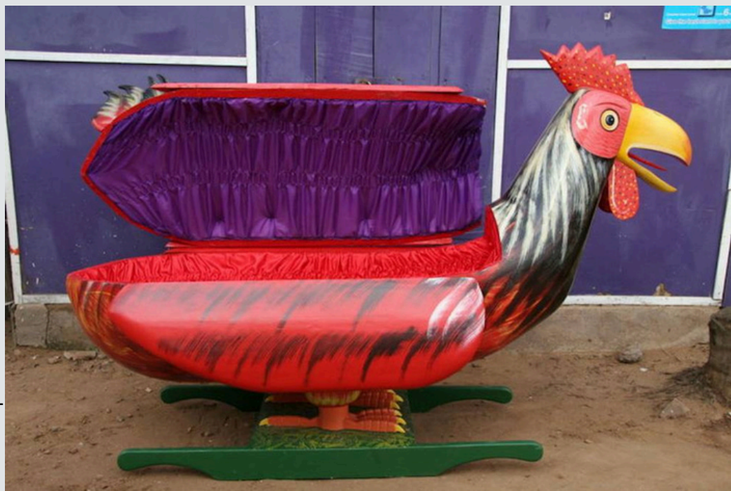
Cercueil personnalisé en forme d'oiseau